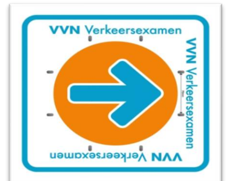
1 De routeborden van het verkeersexamen

In het examen kijken we naar de meest ideale situatie, waarbij jij je zo veilig mogelijk in het verkeer beweegt. Tijdens het Verkeersexamen controleren vrijwilligers van VVN op de volgende punten;